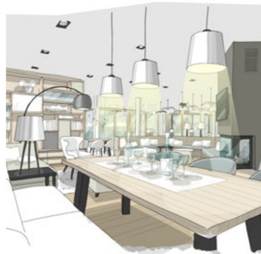
Visualisierungen: Architekt Di Anton Mayerhofer Ziviltechniker GmbH, Thurner Generalplanung GmbH